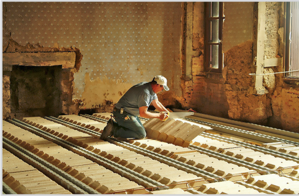
Systemy stropowe RECTOBETON i RECTOLIGHT. Stosowane przy renowacjach. Wymiana stropu charakteryzuje się: łatwością i szybkością montażu, lekkością konstrukcji stropowej – ciężar od 187 kg/m 2 , możliwy montaż bezpodporowy – nawet do 5,8 m, możliwość wykonania wienca na pierwszym rzędzie pustaków, oparcie belek w gniazdach w ścianach.