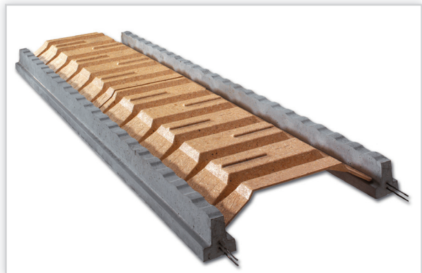
Rectolight. Wypełnienie: panele stropowe z drewna prasowanego. Długość elementu: 120 cm, zastępuje 6 pustaków. Wysokość stropu [cm]: od 16 do 26. Masa: 1 m 2 stropu od 190 kg. Klasyfikacja ogniowa: REI 60. Stosowany we wszelkich budynkach mieszkalnych i użyteczności publicznej, z zastosowaniem sufitów podwieszanych. Uzyskiwane rozpiętości w systemie Rectolight wahają się między 1,8 m do ponad 8,0 m. Łatwość w cięciu i wykonywaniu otworów sprawia, iż jest dopasowany do każdego projektu. Konstrukcja stropu może uzyskać ognioodporność REI 60 (Badanie ITB nr 28818/11/Z00 NP).