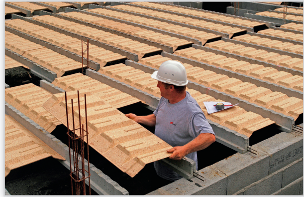
Strop nad przestrzenią wentylowaną. Alternatywne rozwiązanie dla tradycyjnych podłóg na gruncie. Zalety: wentylacja przestrzeni podpodłogowych, eliminacja możliwości popełnienia błędów wykonawczych, zastosowanie zamiast tradycyjnej posadzki na terenach gruntów spoiстых to rozwiązanie łatwiejsze w wykonaniu i bardziej ekonomiczne.