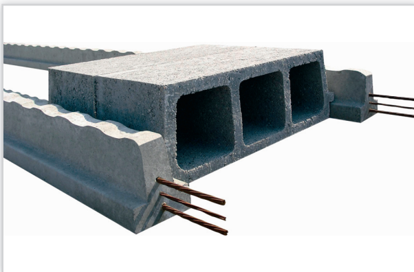
Rectobeton – wypełnienie pustaki z czystego betonu. Wysokość całkowita stropu [cm]: od 14 do 340. Masa: 1 m 2 stropu od 235 kg. Klasyfikacja ogniowa: od REI 60 do REI 240. Stosowany we wszystkich rodzajach budynków, na wszystkich kondygnacjach uzupełnieniem systemu są: zbrojenia przy podporach, zgrzewane maty siatki stalowej oraz beton monolityczny wylewany na budowie.